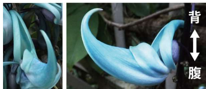
図 1: マメ科の左右相称花

花は被子植物の生殖器官であり、花の形態は被子植物の進化に大きな影響を与えてきた。中でも花の対称性は、送粉者との相互作用を制御し、生殖の成功を左右する要因となり得る。花の対称性は、大別すると放射相称と左右相称に分けられる。左右相称花は、送粉者に対応した背腹軸（あるいは花序の主軸に対する向背軸）について左右対称性を示し、背腹方向には非対称性を示す（図 1）。左右相称花は、昆虫など送粉者の接触部位や行動の制御、送粉者の選別などにより、特定の送粉者との安定的な関係を築くことができる。そのため、左右相称花の系統は爆発的な種分化を示すことが多い [5]。ここで注目するマメ科は、ジャケツイバラ亜科の一部などを除いて、左右相称花をもつ。それでは、左右相称性はどのような発生過程の変化により確立されてきたのだろうか。