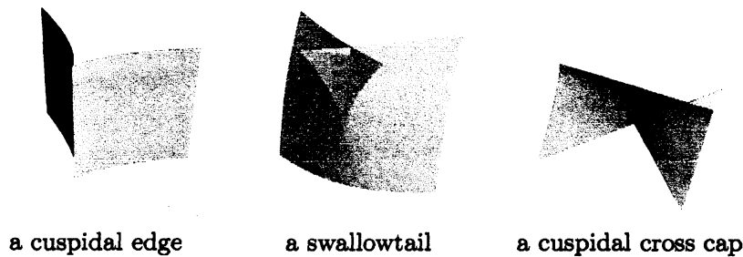
図1 CMC-1面のジェネリックな特異点

特異点をもつが、複素解析的なデータで表現できることから、CMC-1面の大域的な性質を研究することは自然である。そのために完備性の概念を定義しよう：