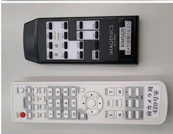
←前／後カメラ切替リモコン