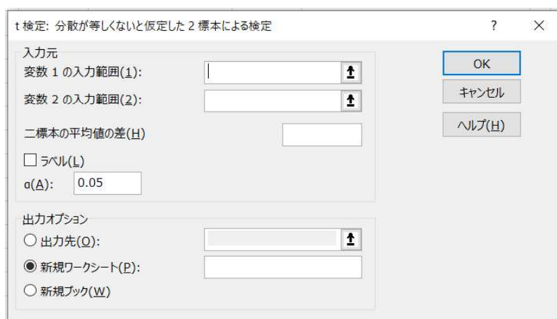
図 2: 「t 検定」ウィンドウ