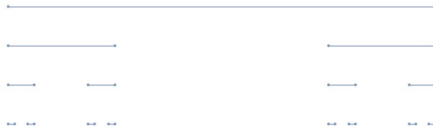
図 1. L_{0,1}(\lambda) の構成段階