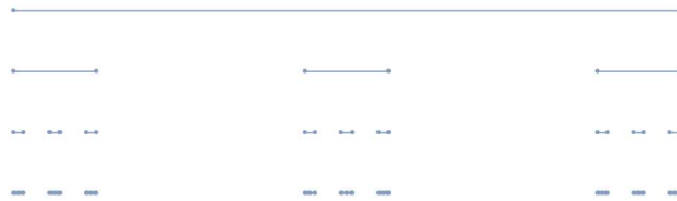
図 2. L_{0,1,2}(\lambda) の構成段階