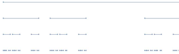
図 3. L_{0,1,3}(\lambda) の構成段階